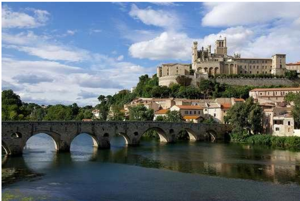
Avec 24,4% en 2015, Béziers affiche le taux de vacance commerciale le plus élevé de France.