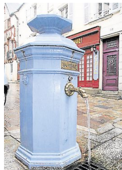
La fontaine de la Grande-Rue est l'une des rares, sinon la seule, à proposer de l'eau potable. Les autres sont à sec ou décoratives. Comme celle de la Trémoille.

Les fontaines cessent de fonctionner au moment où l'eau courante arrive dans tous les foyers. Surtout que des règles d'hygiène en limitent l'utilisation. À notre connaissance, seule celle de la Grande-Rue propose une eau potable. Les autres sont sans